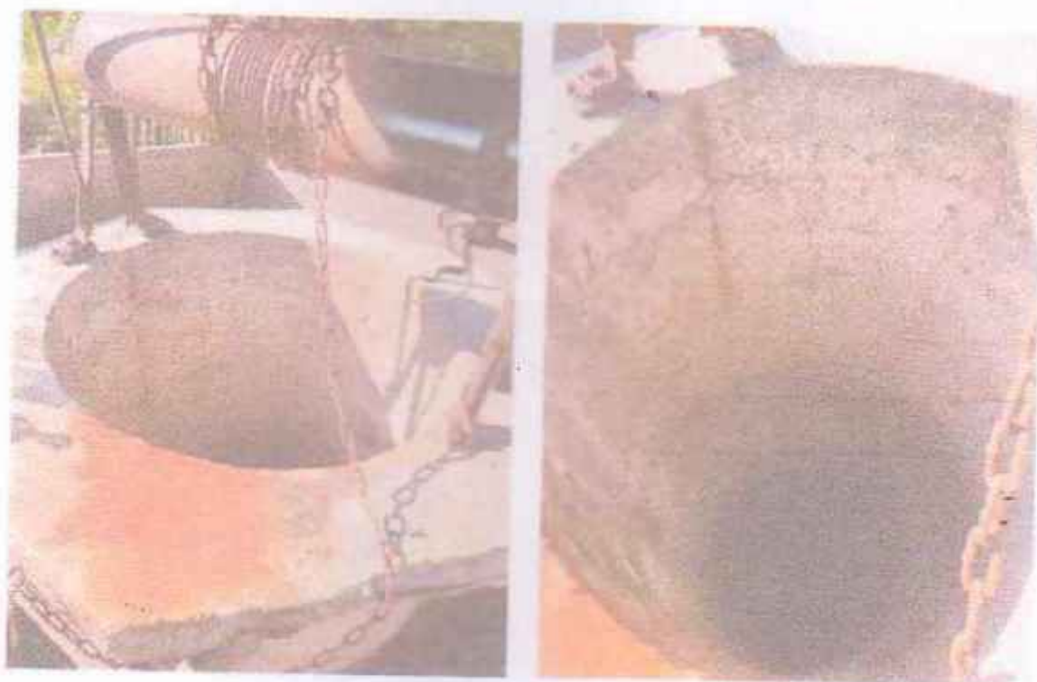
Малюнок 3.15 - Зовнішній вигляд криниці № 3н

Обстеження водопункту № 3н показало, наявність зовнішнього облаштування криниці у вигляді залізобетонних кілець та підйомного механізму (Мал. 3.15)