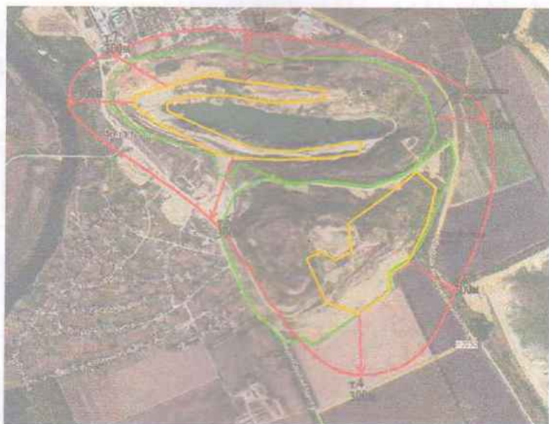
Мас.3.2 Сторінка схеми з нанесеними координатами контрольних точок.