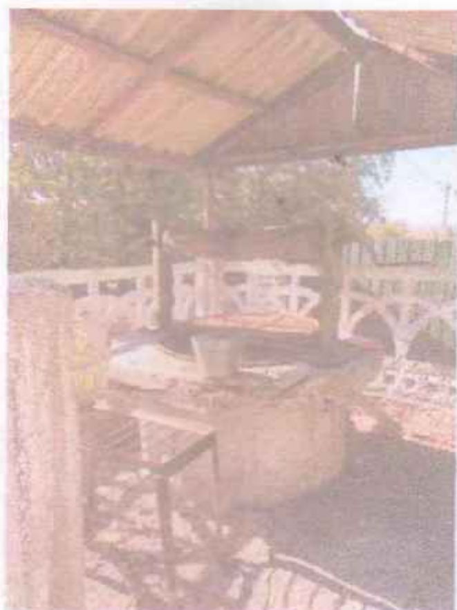
Мал.3.16 – Зовнішній вигляд криниці № 2п