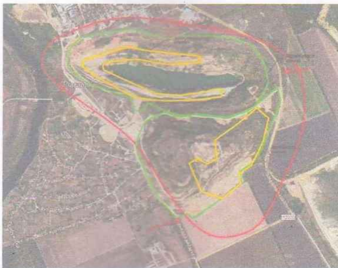
Міст. А.3 Ситуаційна карта з нанесеними географічними координатами точок

Протоколи випробувань та визначення фізико-хімічних показників наведено в Додатку 4. Результати проведення моніторингу ґрунтів наведені в таблиці 3.2-4