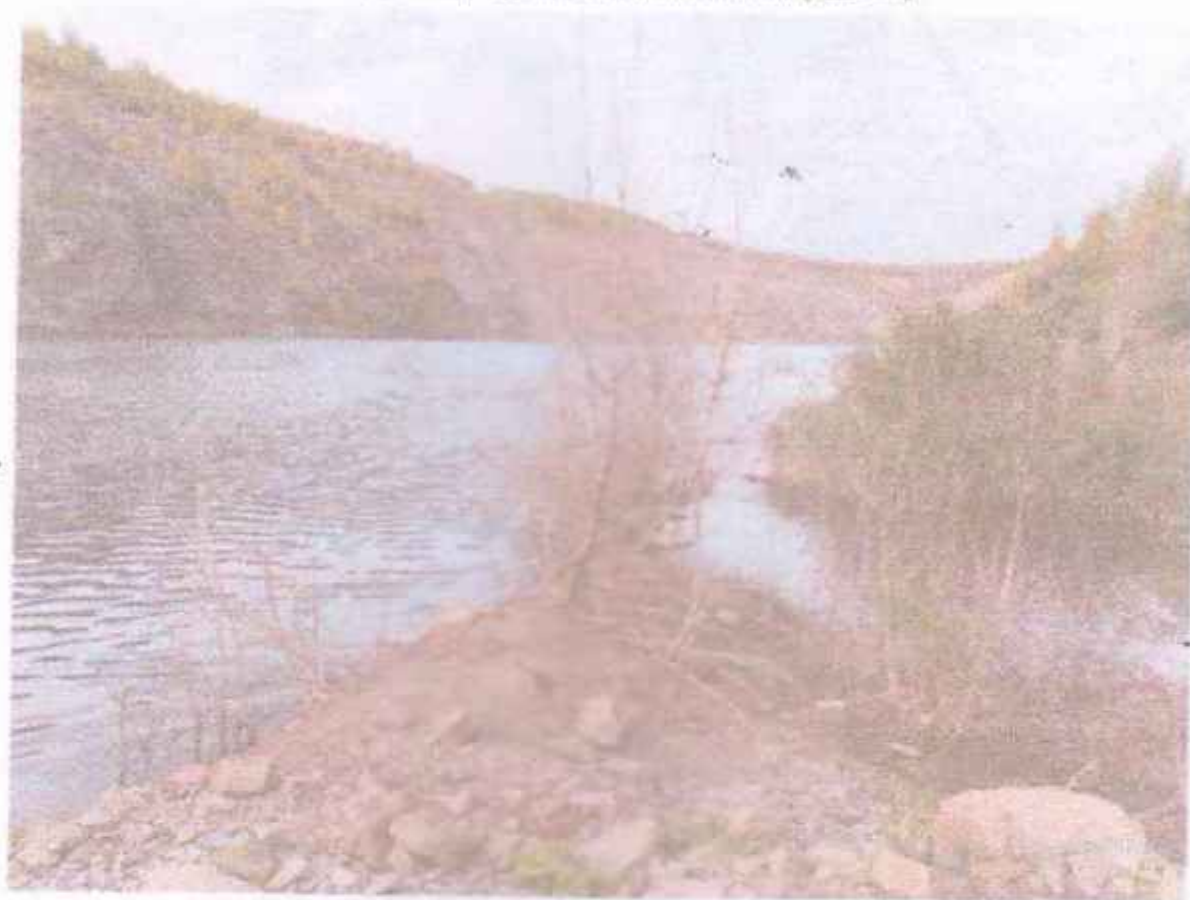
Мал. 3.6 - Фото затопленого дна кар'єру

Дно кар'єру повністю затоплено (мал. 3.6).