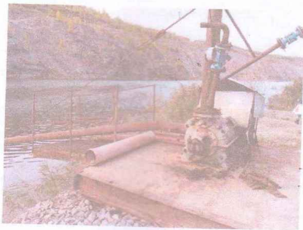
Рисунок 3.7 – Насосна станція для відкачування води з кар'єру

Вода майже прозора. Біля води зафіксовані поодинокі зарості очерету. В воді наявні водні рослини (водорості), що свідчать про довгий час її накопичення.