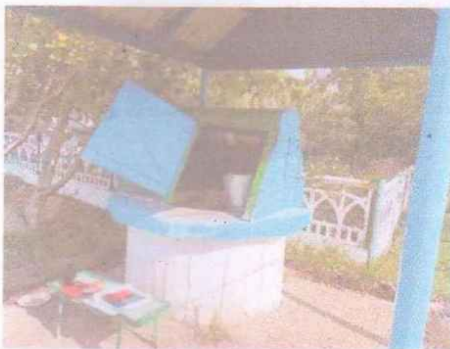
Мал. 3.17 – Зовнішній вигляд криниці № 1п